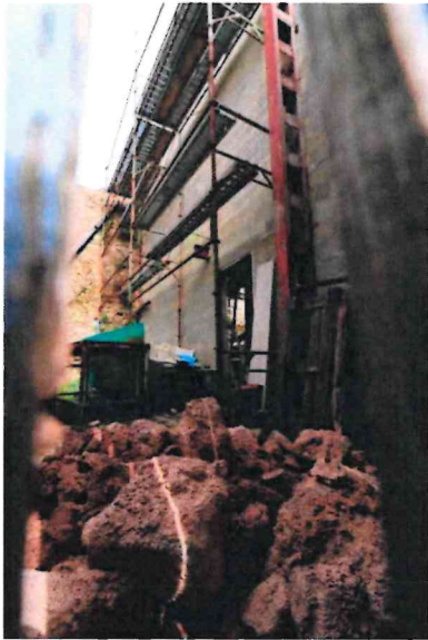
Photographie n° 13