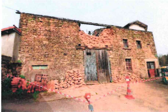
Photographie n° 1

3849 / EXPP / 2 rue de l'Ancienne Fontaine NIEUL