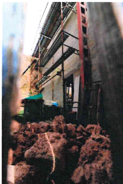
Figure n°4 : Photographie de l'intérieur de l'ouvrage

La prise de vue de la Figure n°3 a été prise sur la parcelle voisine. L'ouvrage en état de dégradation avancé est en limite de propriété des parcelles mitoyennes.