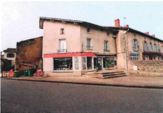
Photographie n° 15