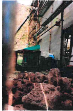
Photographie n° 12