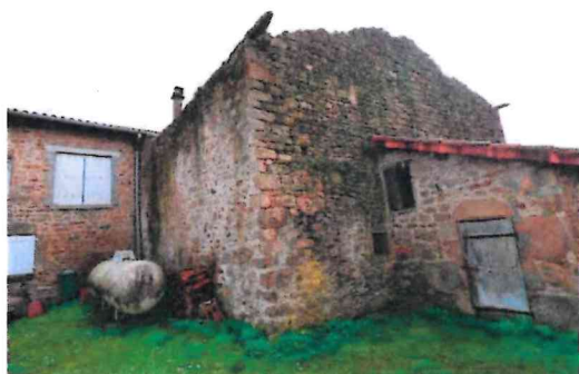
Photographie n° 7