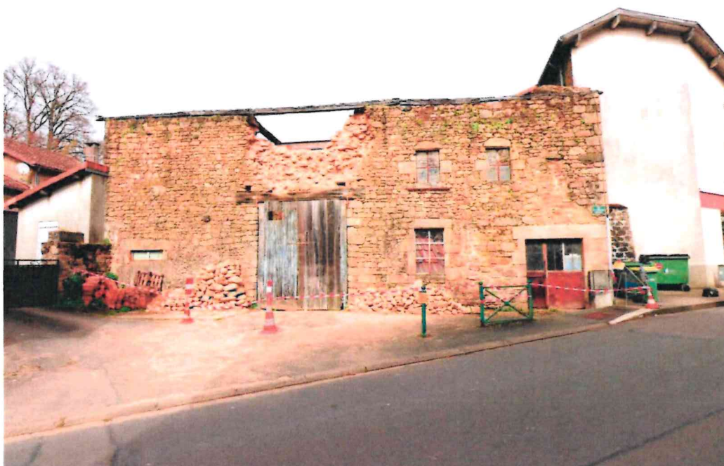
Figure n°2 : Photographie de la façade principale côté voirie

Lors de nos investigations, nous avons pu constater que l'ouvrage a subi un effondrement partiel situé au-dessus du linteau de la porte d'accès cf. Figure 2 .