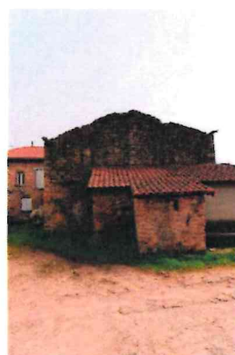
Photographie n° 6