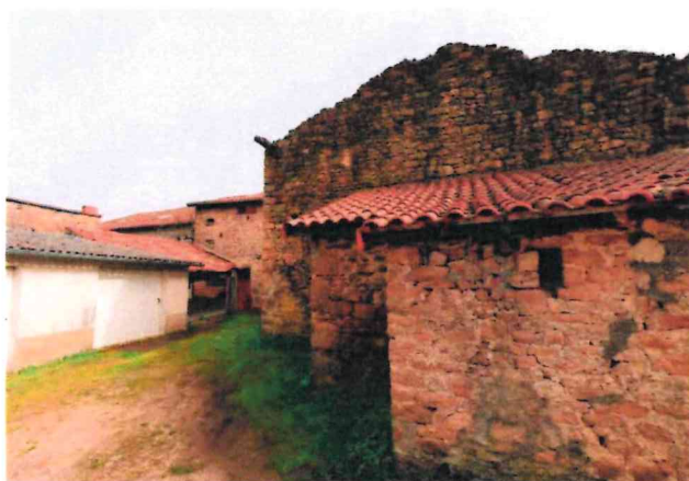
Photographie n° 10