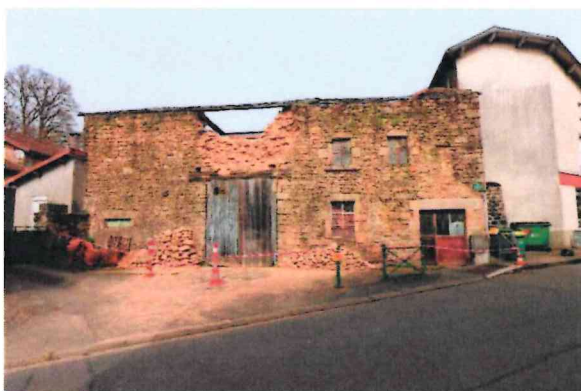
Photographie n° 5