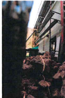
Photographie n° 14