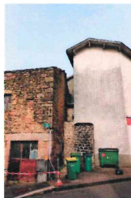
Photographie n° 4