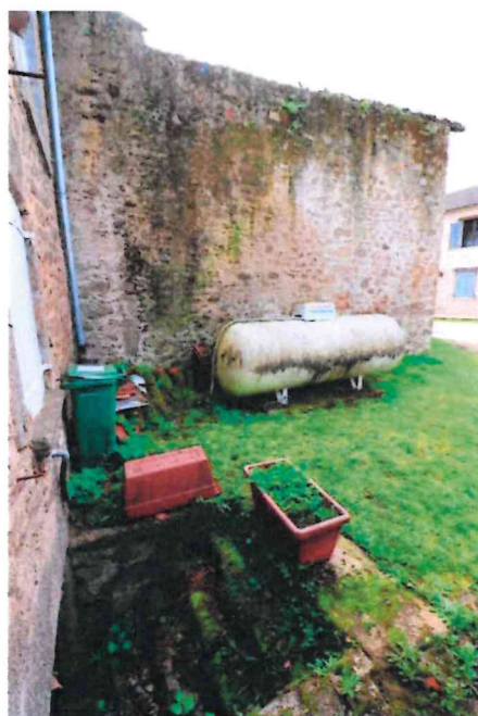
Photographie n° 9