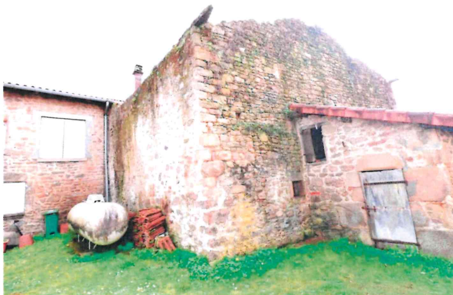
Figure n°3 : Photographie de la façade arrière

La prise de vue de la Figure n°3 a été prise sur la parcelle voisine. L'ouvrage en état de dégradation avancé est en limite de propriété des parcelles mitoyennes.