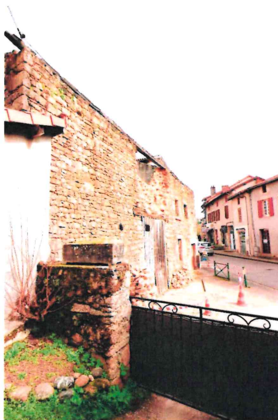
Figure n°5 : Photographie de l'effondrement

Les eaux ruissèlent alors entre les demi-murs et entraînent un ravinement des liants qui assurent la cohésion mécanique de l'ensemble. Ceci fragilise la structure et entraîne inéluctablement l'effondrement d'au moins un demi-mur, ce qu'à subit l'ouvrage.