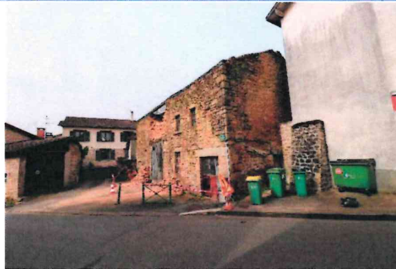
Photographie n° 2