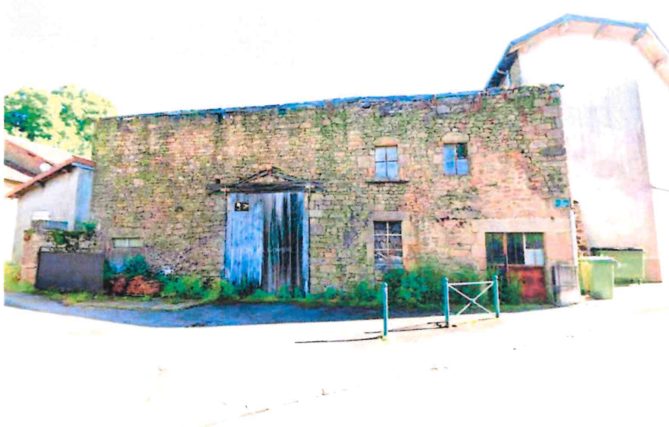
Figure n°1 : Vue Google Street View (mai 2025)

Les investigations sur site ont été effectuées le 05 mars 2026 pour apprécier l'état du bâtiment.