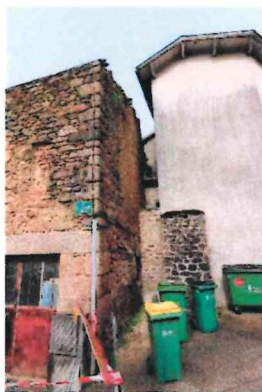
Photographie n° 3